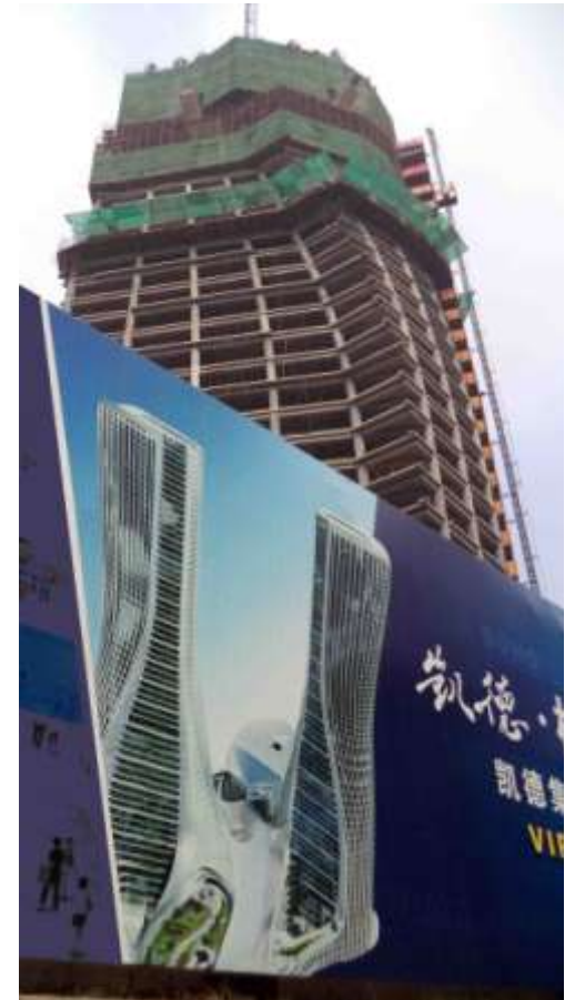
Raffles City Complex ( UNStudio)