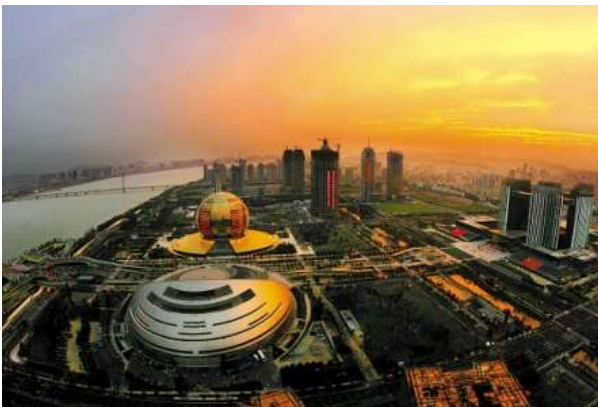
Het nieuwe Central Business District van Hangzhou aan de Qiantang rivier.