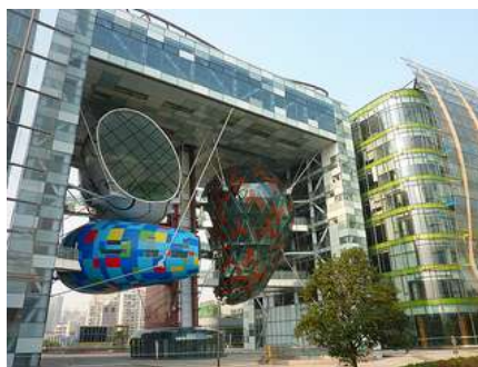
Shanghai Cruise Terminal (Sparkarchitects)