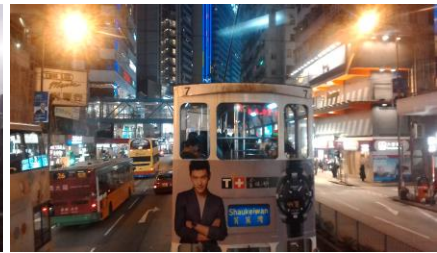
Hong Kong Hennessy Road