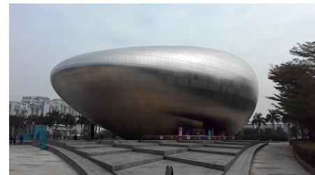
Shenzhen OCT Creative Exhibition Centre