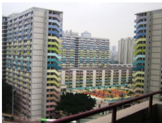
Hong Kong Choi Hung (Regenboogwijk) uit 1963