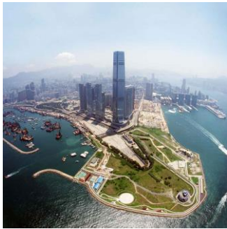
Hong Kong West Kowloon Cultural District Park (WEST8)