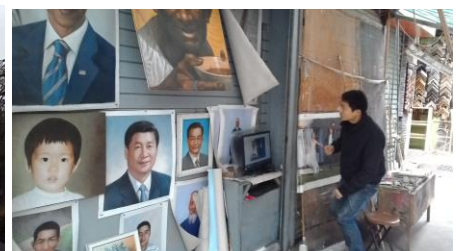
Shenzhen kunst-kopieer-wijk Dafen