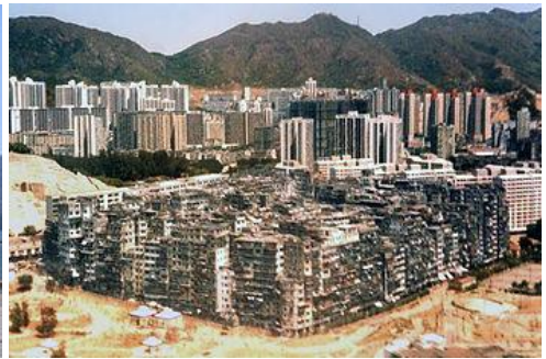
Kowloon Walled City (foto uit '92, is nu een parkje)