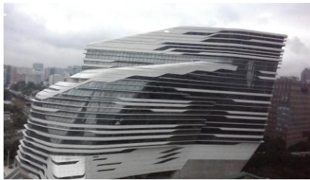
Hong Kong Jockey Club Innovation Tower