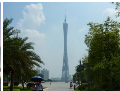
Guangzhou TV-Tower (Hemel & Kuit)