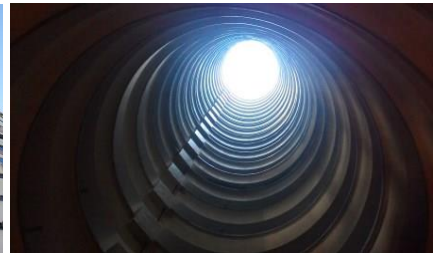
Hong Kong Lai Tak Tsuen public housing uit '75