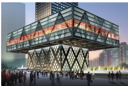
Shenzhen Stock Exchange (OMA)