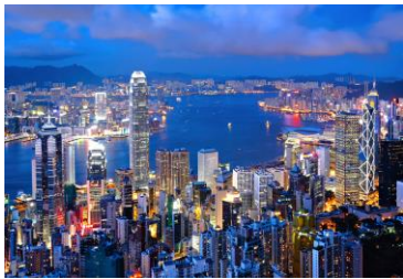
Hong Kong The Peak